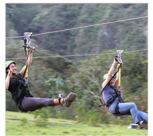
②ジップライン(3時間)

※10歳以上、身長137cm以上、 体重104キロ以下の方が対象 ※サンダル着用不可