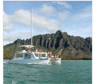
⑥カタマランクルーズ カネオハ湾・フィッシュホド

※10歳以上、身長145~200cm 体重38~114キロ以下の方 ※サンダル着用不可