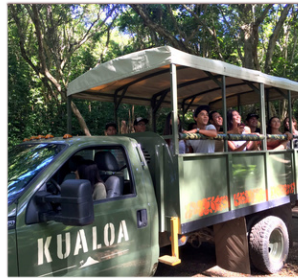
④ジュラシックアドベンチャー(2時間半)

※運転は21歳以上で免許証保持者、同乗者5歳以上 ※参加前にテストコースあり ※最少催行2名