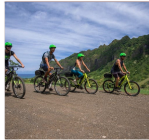
⑤Eマウンテンバイク(初心者/2時間)